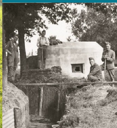
Nederlandse bunker in de gemeente Emmen