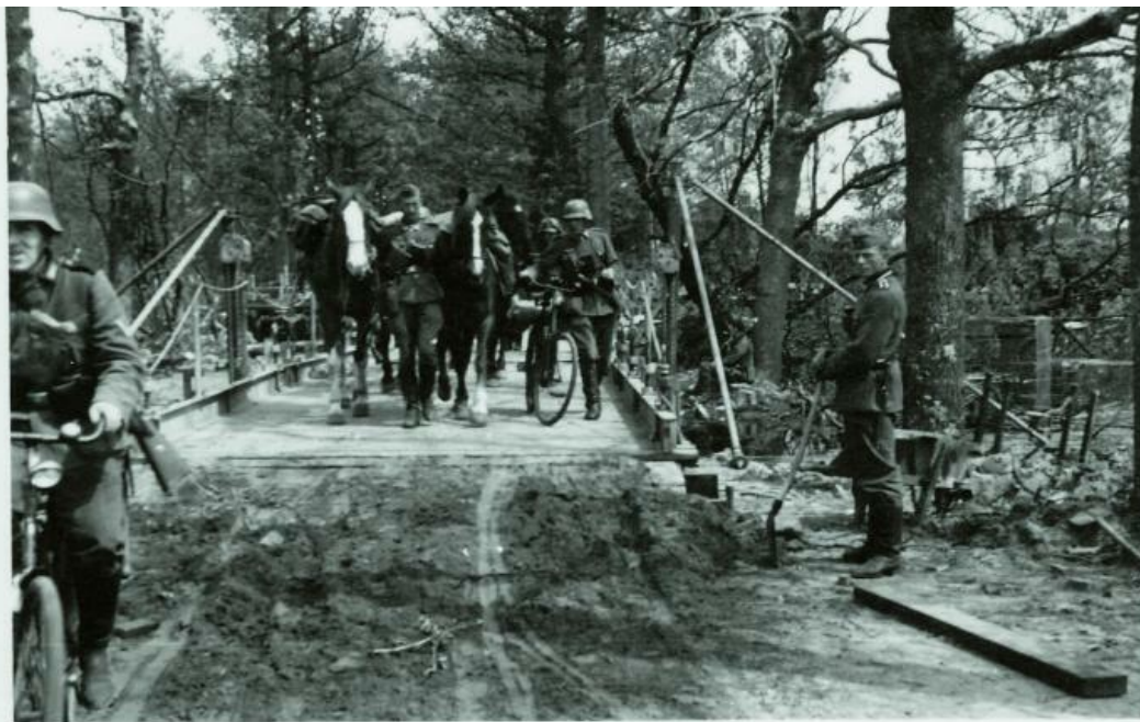
Duitse soldaten te paard komen bij Zwartemeer en Schoonebeek de grens over.

Op 14 mei bombardeerde Hitler Rotterdam. Op 15 mei gaf Nederland zich over, uit angst voor nog meer platgegooide steden. Nederland was nu officieel bezet gebied.