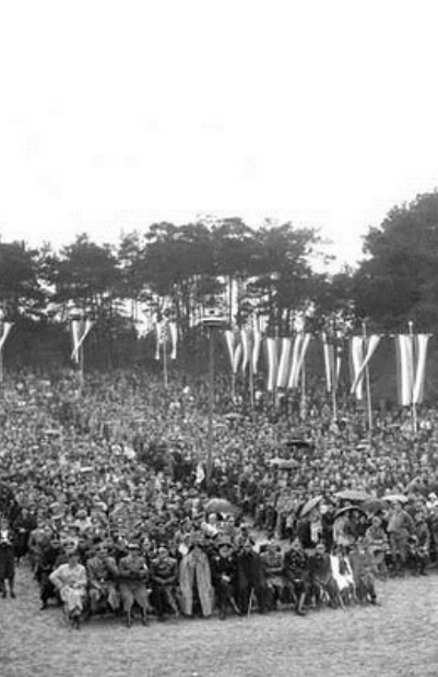
NSB landdag in Drenthe