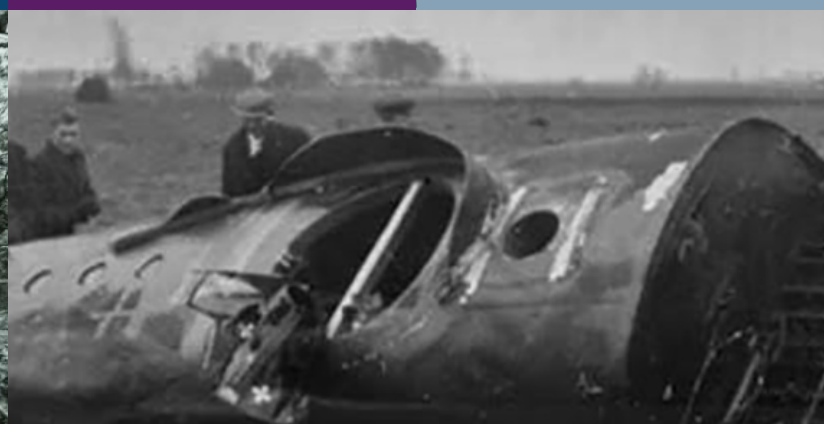
Oorlog in de lucht Bommenwerper neergestort te Schoonebeek.