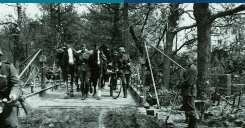
De Meidagen Duitse soldaten trekken de grens bij Zwartemeer over, opweg naar Klazienaveen.