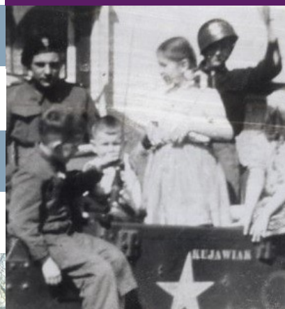
Poolse bevrijders in Drenthe