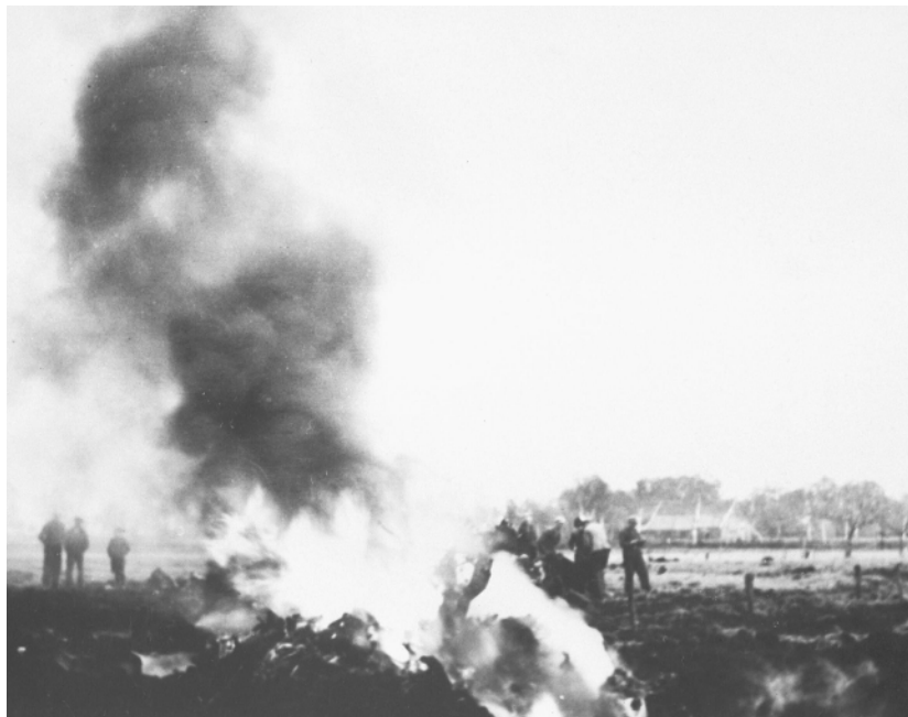
De brandende resten van Mosquito RS532 YH-E op 23 april 1945