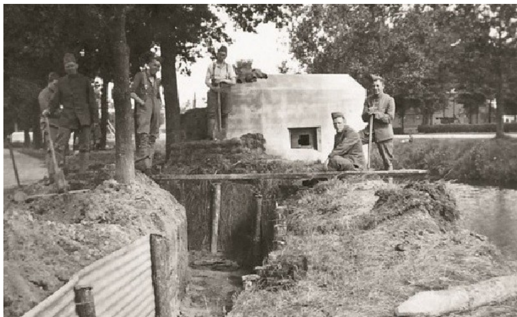
Nederlandse soldaten bij hun kazemat met loopgraaf langs het kanaal in Odoornerveen.