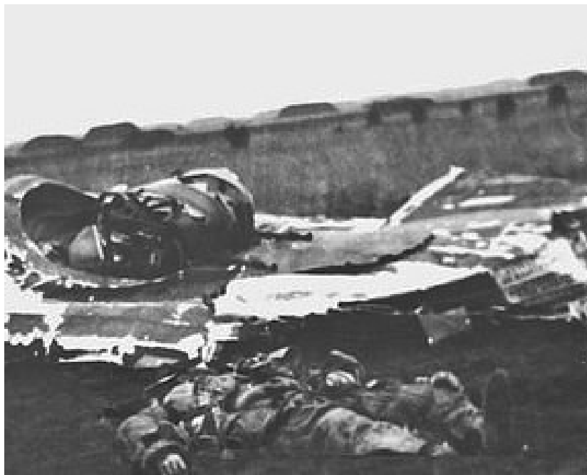
Wrak van de Lancaster Mk.III W4984 AR-J van RAAF 460 Squadron met een overleden bemanningslid.