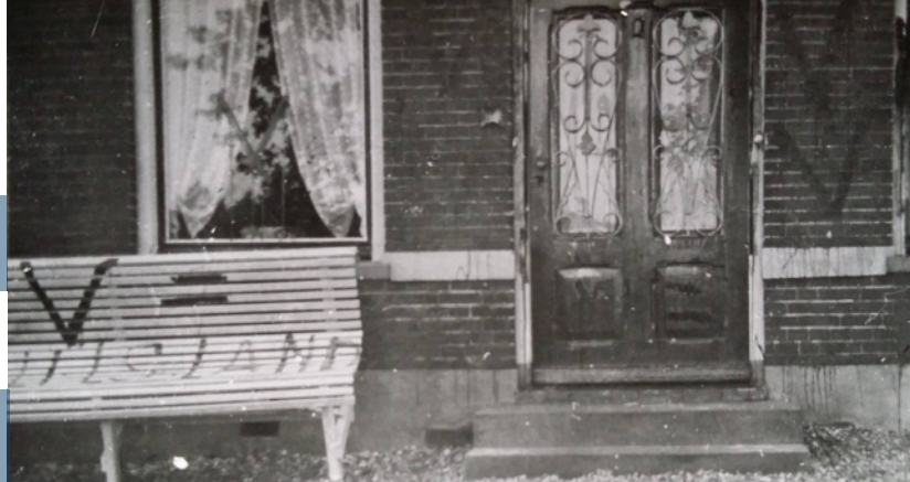
Het Verzet De woning van een inwoner van Klazienaveen, besmeurd met verf door het verzet.