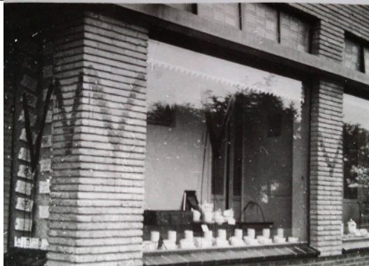
Deze winkel is besmeurd met verf. In deze zaak zit nu sportschool Extension

In het Drentse grensgebied werkt 'de wilde' verzetsgroep De Krim, die zich niets aantrekt van overleg met andere groepen, die vinden dat ze veel te veel risico's nemen.