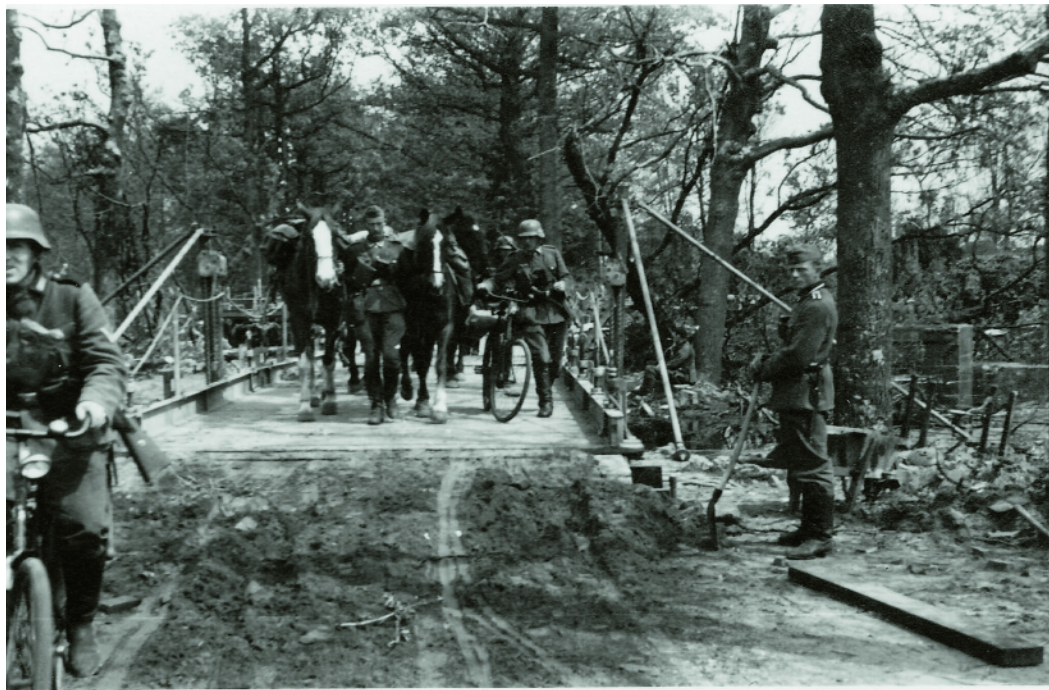
Duitse soldaten te paard komen bij Zwartemeer en Schoonebeek de grens over.

Op 14 mei bombardeerde Hitler Rotterdam. Op 15 mei gaf Nederland zich over, uit angst voor nog meer platgegooide steden. Nederland was nu officieel bezet gebied.