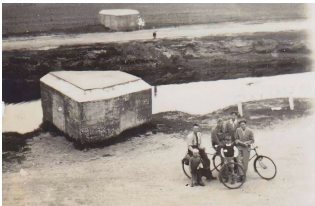
De twee bunkers bij de Kamerlingswijk, waar nu een dam ligt op de weg naar Schöninghsdorp.