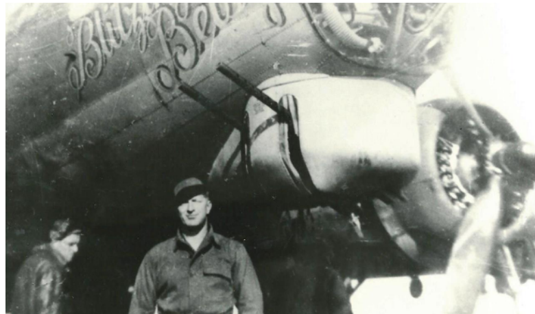
De neus van de Blitzing Betsy met 2 machinegeweren aan de onderkant.

Zou jij zelf willen vechten voor de vrijheid van een ander land? Leg uit waarom.