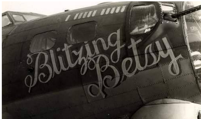
De naam op het toestel geschilderd.