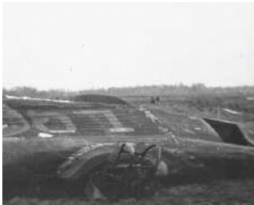
Lancaster JB280 LQ-K