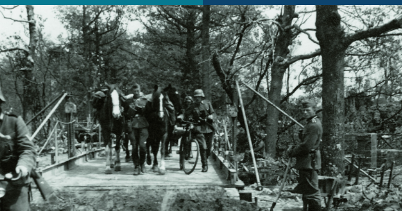
De Meidagen Duitse soldaten trekken de grens bij Zwartemeer over, opweg naar Klazienaveen.